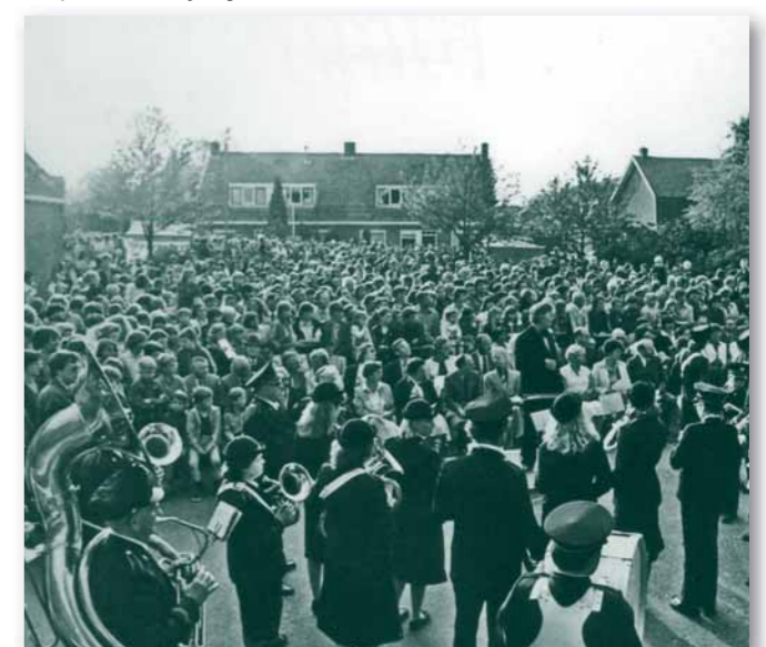
Dorpsfeest 650-jarig bestaan

Alles bij elkaar is het een bonte stoet van gedichten en fotos, die de Heerjansdammer vertederend zal doen zeggen: Wat mooi en ach ja wat een historie die zoveel herinneringen oproept. Een boek dat dik waard is in bezit te hebben. Het Historisch Genootschap verdient een groot compliment voor deze voortreffelijke uitgave, waaraan ook de dorpsraad en financiële bijdrage heeft mogen leveren. |